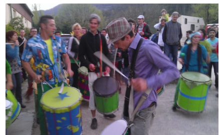
La toute dernière association alzonaise « Festiv'Alzon », lors de la soirée du 12 avril 2014 aux couleurs Brésiliennes et aux sons de la Batucada.