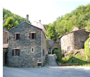
Hameau de la Goutte ( Altitude 671m )

Cet écrin de tranquillité continue de vivre. Certains viennent y passer leurs vacances, d'autres ont leurs résidences secondaires mais toute l'année 2 familles y vivent et préservent ce joyau.