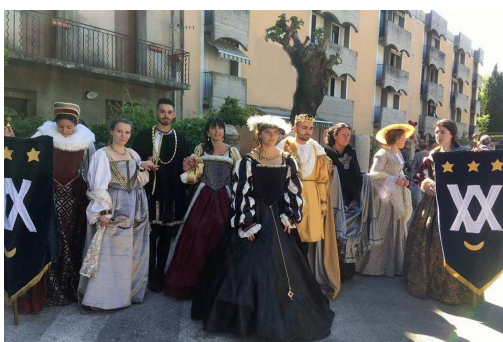
MetA Atelier Viganais