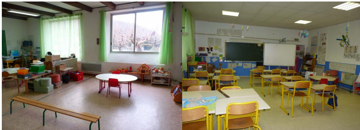
salles de classes maternelles et élémentaires

Trois grandes salles spacieuses et ajourées constituent principalement le bâtiment de l'école.