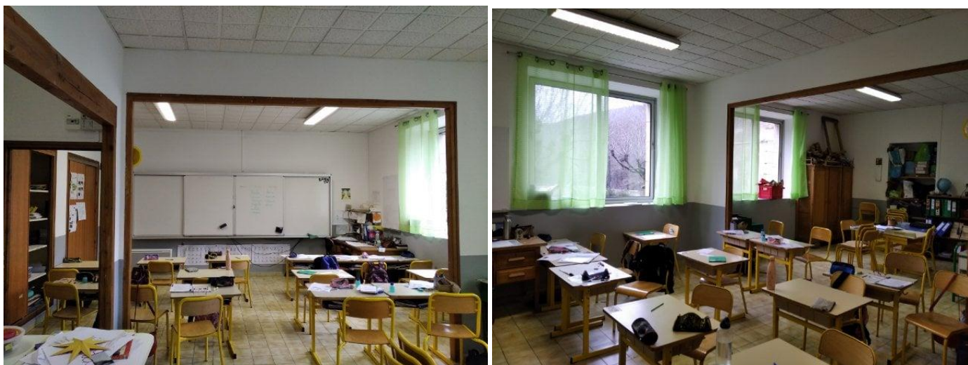
Salle de classe des élémentaires (avec Tableau Numérique permettant des corrections en direct, affichages des productions des élèves, modèles d'écriture).

Trois grandes salles spacieuses et ajourées constituent principalement le bâtiment de l'école.