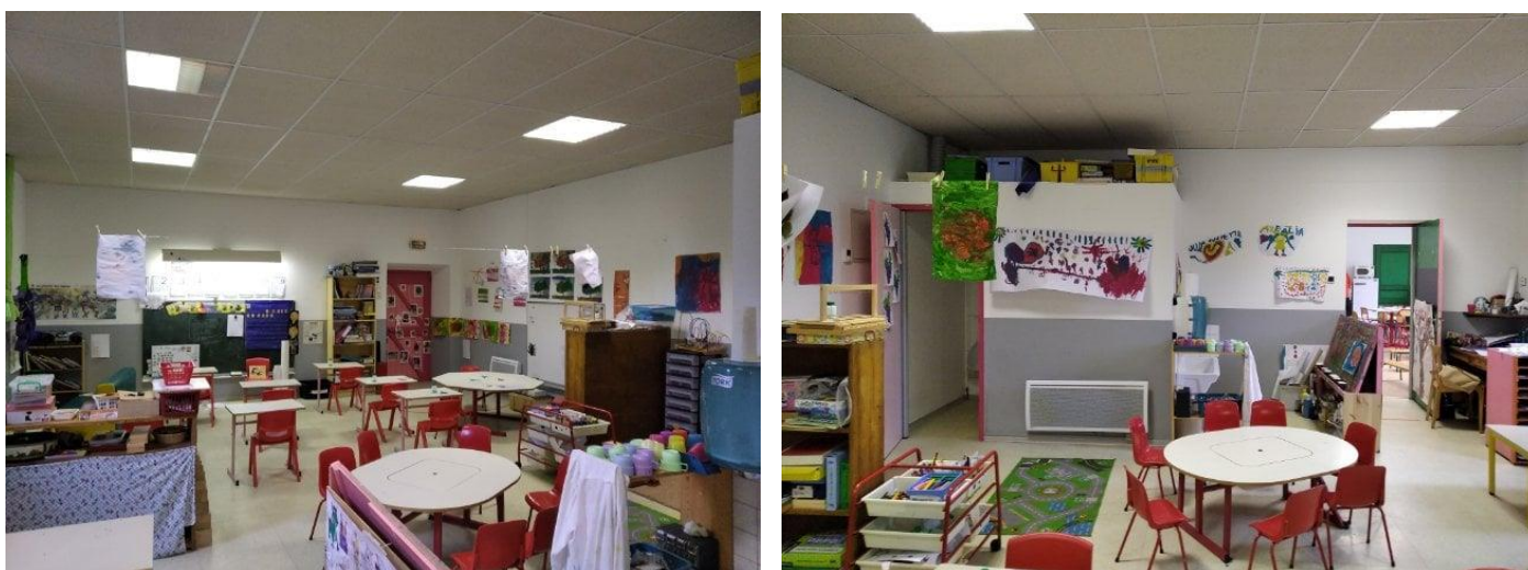
Salle de classe des Maternelles